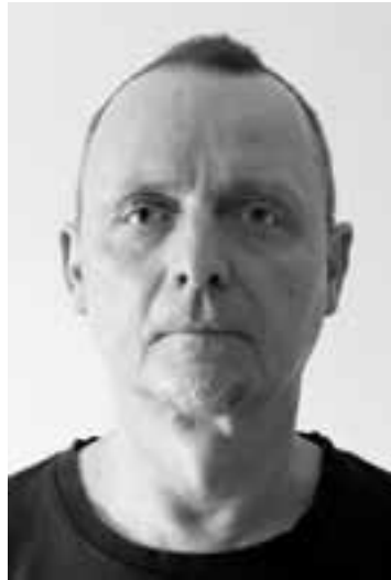
Somnia , druk cyfrowy na papierze, 14 x 100 cm, 2024, zdjęcie i postprodukcja Tereza Samková