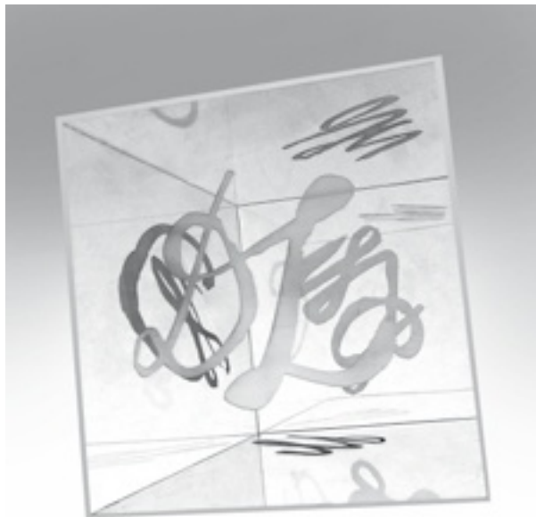
Parafy , grawerowane pleksi, 21x21 cm, 2024

Mieszka i pracuje w Czechach w miejscowości Vřesina koło Bílovca. Od końca lat 70. jej prace mają charakter konceptualny. W y s t a w i a indywidualnie od 1989 roku, a zbiorowo od 1981 roku. W latach 1991–2012 pracowała w Katedrze Edukacji Artystycznej na Wydziale Pedagogiki Uniwersytetu Ostrawskiego. Zajmowała się mediatyzacją sztuki wizualnej, szczególnie w obszarze konceptualizmu. Obecnie zajmuje się twórczością artystyczną, działalnością edukacyjną i kuratorską.