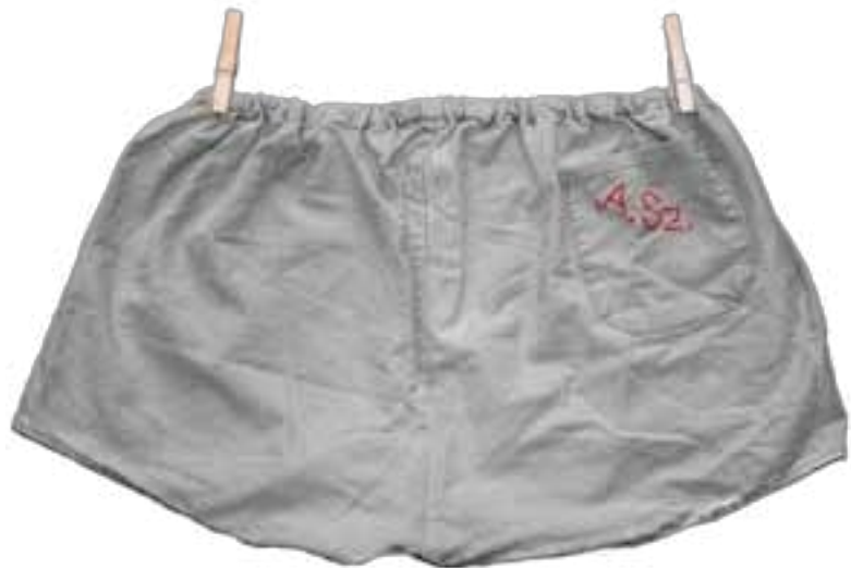
Monogram , 50x30w cm, 2024

w Ołomuńcu. Na przestrzeni lat jego twórczość w zakresie malarstwa swobodnego wahała się od abstrakcji lirycznej z elementami tasyzmu, poprzez malarstwo formalne o dziecięcej ekspresji, po abstrakcję geometryczną wykonywaną w ekspresyjny sposób. Przy znacznym eksperymentowaniu z różnymi mediami, jego prace są nieklasyfikowalne, prawie zawsze konceptualne. Koncepcja ta jest również widoczna w prezentacjach wystawienniczych, w których ważną rolę odgrywa faktyczna instalacja wystawianych obiektów. Pracuje również z wolną rzeźbą, od drewna po żywicę epoksydową. W ostatnich latach pracuje nad asamblażami, w których wykorzystuje różne znalezione lub sztucznie stworzone elementy, które łączy w kompozycje o nieco ironicznym znaczeniu.