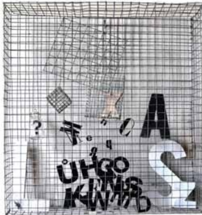
Bez tytułu , 39x44 cm, 2024

Zajmuje się grafiką użytkową, zwłaszcza plakatem i sztuką wolną. Kurator Galerii Půda w Czeskim Cieszynie, w ciągu ostatnich dziesięciu lat pracował również jako kurator wystaw w Kawiarni Literackiej AVION w Czeskim Cieszynie.