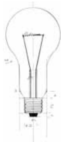
Podpis, świąteczny, 21x29,7 cm, 1977