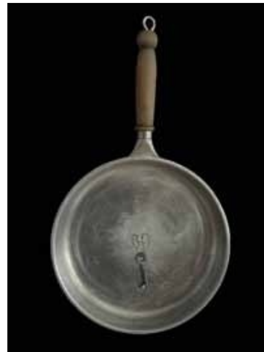
Autoportret cieszyńskiej kury domowej, 30x50 cm, 2024 r.

Kulturoznawca, socjolog, doktor habilitowany nauk humanistycznych, profesor w Instytucie Nauk o Kulturze na Wydziale Humanistycznym Uniwersytetu Śląskiego w Katowicach. Jego zainteresowania badawcze koncentrują się na obszarze kultury i sztuki, w y k ł a d a w tym zakresie na Wydziale Artystycznym. i Nauk o Edukacji. Oprócz pracy badawczej i dydaktycznej, ważnym aspektem jej działalności są różne formy organizacji współpracy na poziomie regionalnym Jeśli chodzi o działalność artystyczną, ma dorobek w dziedzinie malarstwa, literatury i fotografii. Poza tym Jego twórczość naukowo-badawcza obejmuje malarstwo, fotografię i literaturę (m.in. Diabelskie zarośla, Niebieskie pudełko do patrzenia na łąkę).