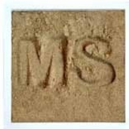
"Piaskownica" , 26,5x26,5 cm, 2024