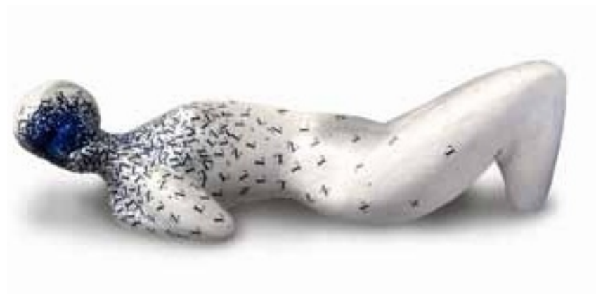
Bez tytułu , 36x11 cm, 2024

Ukończyła grafikę na Akademii Sztuk Pięknych w Ostrawie oraz scenografię na Akademii Sztuk Scenicznych w Brnie. Od 2010 roku zajmuje się głównie scenografią teatralną w Czechach i na Słowacji. Regularnie współpracuje z Teatrem Petra Bezruča w Ostrawie, Teatrem Husa na Provázku w Brnie, Teatrem Narodowym w Brnie, Teatrem Radost, Teatrem Švandov, Teatrem im. w Pradze czy Teatrze Miejskim w Zlinie. W swojej wolnej twórczości skupia się na grafice, instalacjach przestrzennych i rysunku.