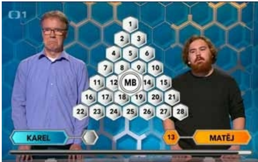
"Karl, chcesz odpowiedzieć? Nie", wydruk cyfrowy na płótnie, 20x30 cm, 2024

Ukończyła Wydział Sztuk Pięknych w Brnie, jest malarką, rysowniczką, i ilustracją, kolekcjonuje komiksy, a także jest pełnoetatowym dramaturgiem muzycznym w klubie Fléda w Brnie. Mieszka i pracuje w Brnie.