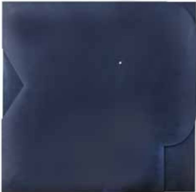
Monogram "KP" , guma na drewnie, kryształ Swarovskiego, 36,5x36x4 cm, 2024