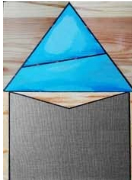
AM - opcja subtelnych bytów , asamblaż, olej, akryl, deska, płótno, 30x40 cm, 2023

Absolwent Uniwersytetu Śląskiego w Katowicach oraz Akademii Sztuk Pięknych w Krakowie. Doktoryzował się i habilitował na Wydziale Malarstwa Akademii Sztuk Pięknych w Krakowie. Obecnie jest profesorem Uniwersytetu Śląskiego, pracuje w Instytucie Sztuk Pięknych w Cieszynie. Jego zainteresowania malarskie zakorzenione są w tradycji greckochrześcijańskiej, którą uważa za wspólne dziedzictwo całej Europy, a której ślady odnajduje w różnych punktach i momentach tzw. świata zachodniego. Stara się badać i ukazywać te problemy.