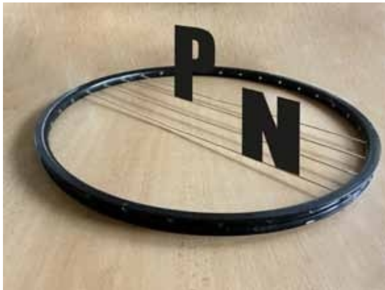
"Następna noc" , 50x20 cm, 2024

Wystawia głównie plakaty i darmowe grafiki. Mieszka w Velo Polska.