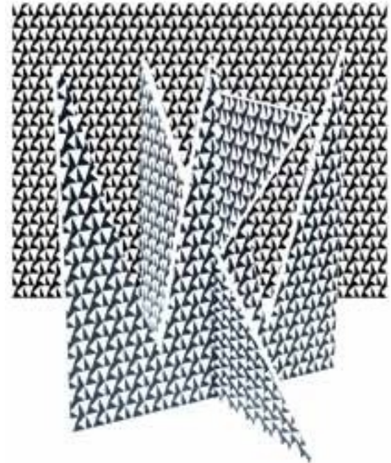
Monogram , druk cyfrowy na papierze, plastik 40x50 cm, 2024 r,

Najczęściej używa mediów mieszanych. Swoje pomysły realizuje również za pomocą nietradycyjnych form teatralnych. Fotografia jest elementem, który uzupełnia i równoważy jego abstrakcyjne prace.