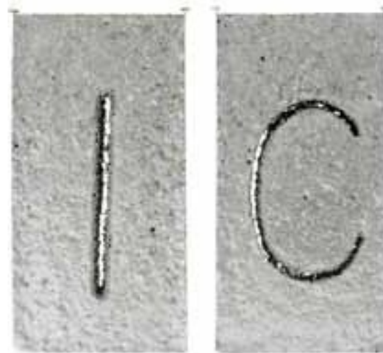
Bez tytułu, szkło piaskowane pianką, 30x60 cm, 2024